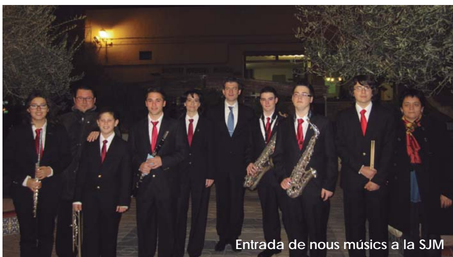
Entrada de nous músics a la SJM