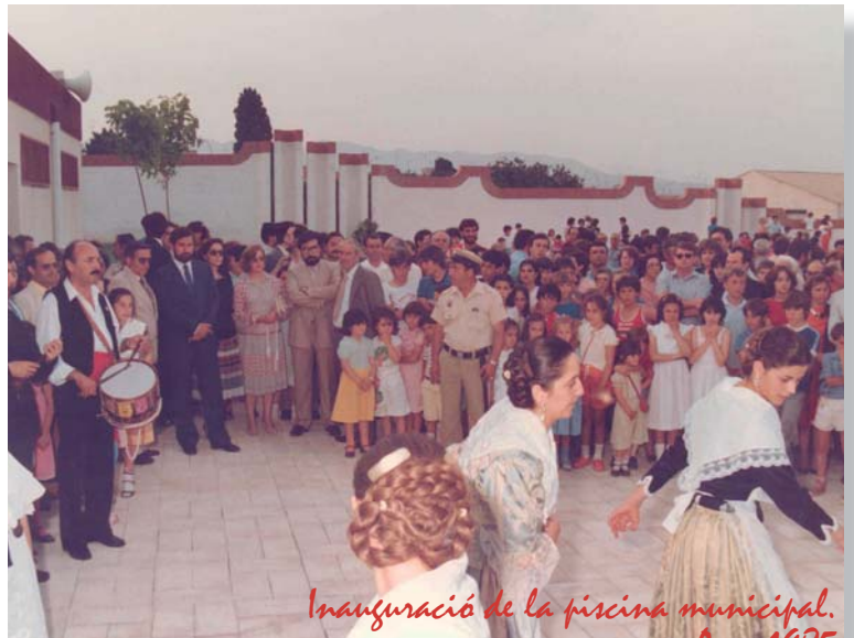
Inauguració de la piscina municipal. Any 1985