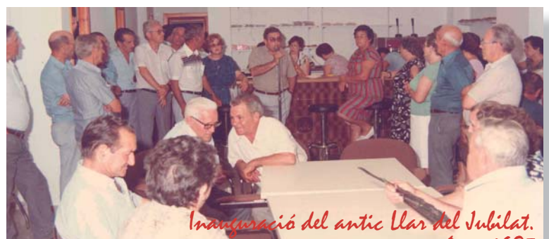
Inauguració del antic Ular del Jubilat. Any 1985