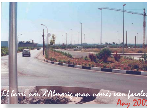
El barri nou d'Almorix quan només eren faroles. Any 2002