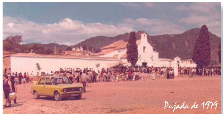
Pujada de 1979