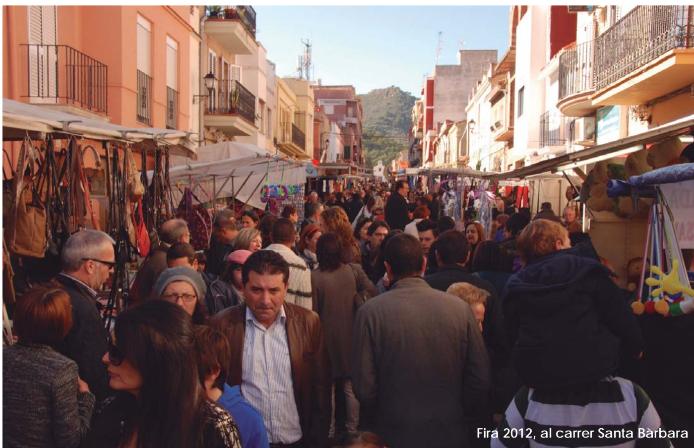
Fira 2012, al carrer Santa Bàrbara