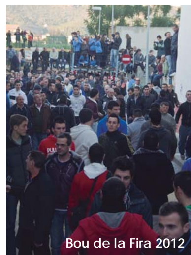
Bou de la Fira 2012