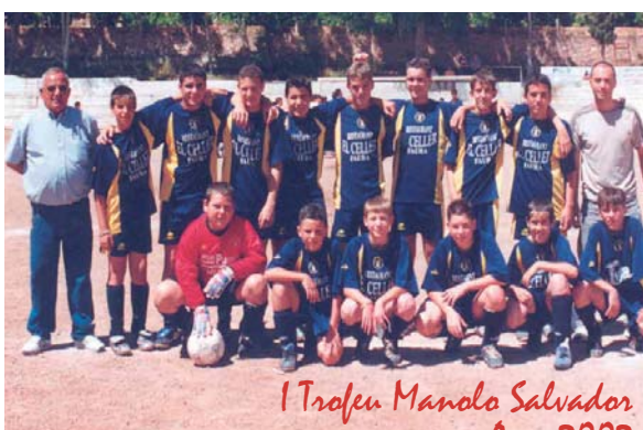
1 Trofeu Manolo Salvador. Any 2002